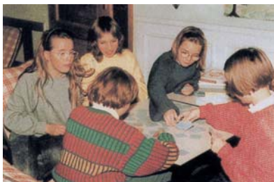
Aufenthaltsraum für Mädchen