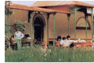
Frühling auf der Terrasse