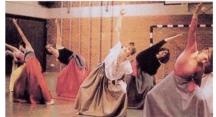
Jazz-Gymnastik in der Turnhalle