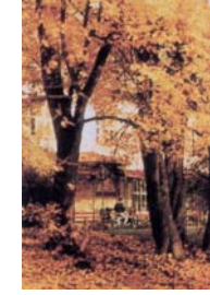
Schloss im Rosenmonat / Herbststimmung