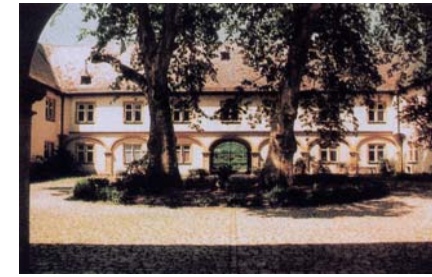
Blick in den Schlosshof