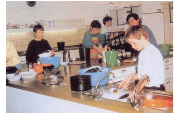
Hauswirtschaft auch für Jungen in der Schulküche