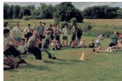
Tauziehen auf dem Sportplatz