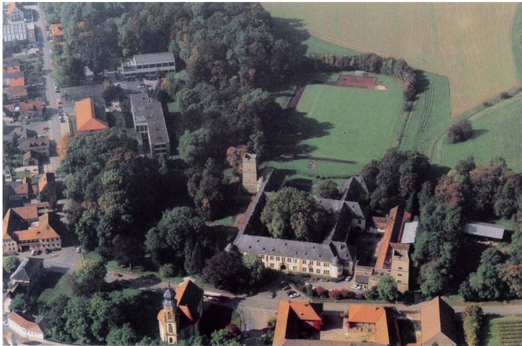
LANDSCHULHEIM SCHLOSS GAIBACH, Bavaria Luftbild

Ergänzt wird das Gai-schule durch eine hofen, welche für externe Schülerinnen und Schüler aus der Region am Rande des Steigerwaldes die weiterführende höhere Schule darstellt.