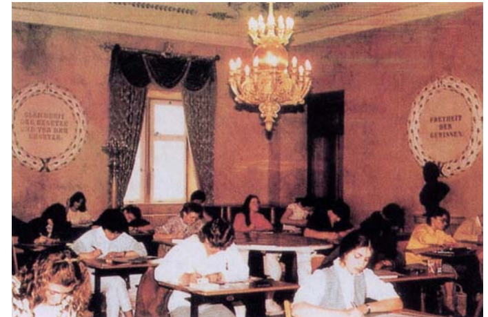
Abitur im Konstitutionssaal