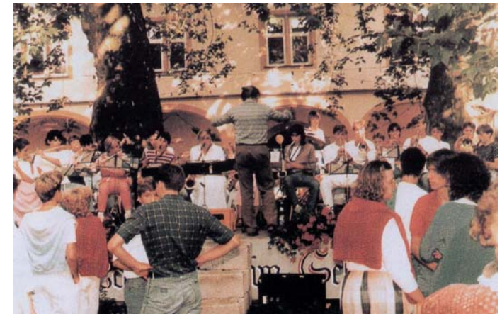
Schülerblasorchester beim Sommerfest