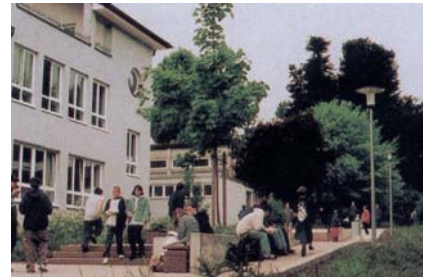
Pause im Schulhof